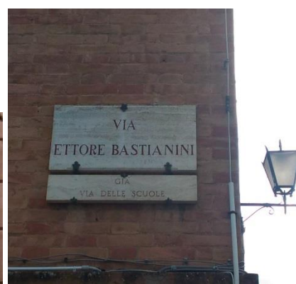
Luoghi di Ettore Bastianini a Siena