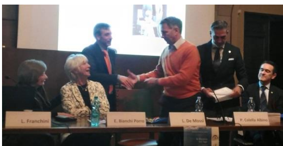
V. Lopane e P. Colella Albino consegnano un riconoscimento al Sindaco di Siena Luigi De Mossi